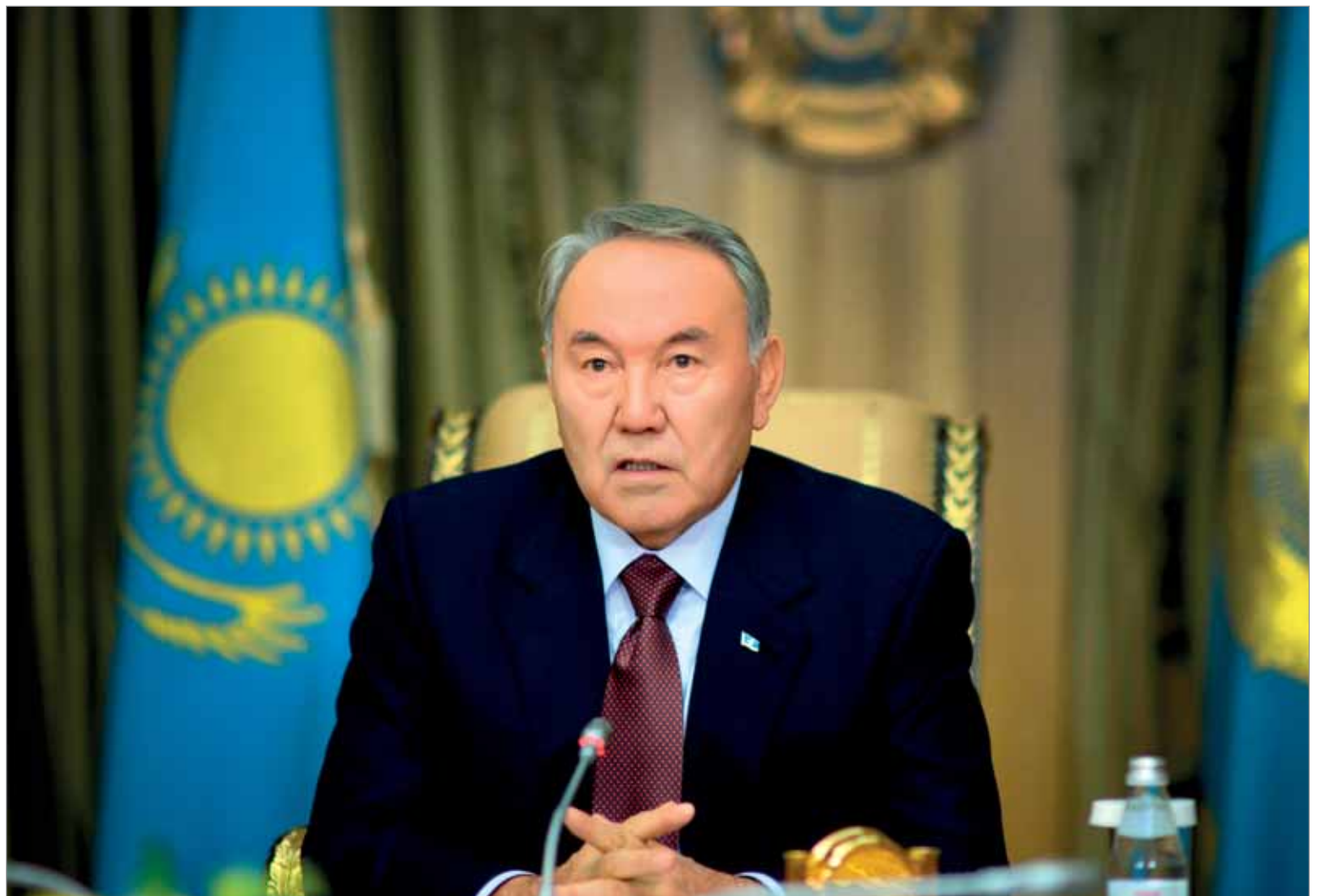
По мнению экспертов, главная проблема всех предыдущих посланий не в постановке задач, а их реализации

В настоящее время многие страны пытаются решить такую же задачу. Уверен, рецепты перехода