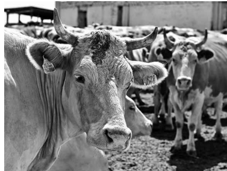
Пять внешних ППУ появятся в пяти районах области, граничащих с Россией.