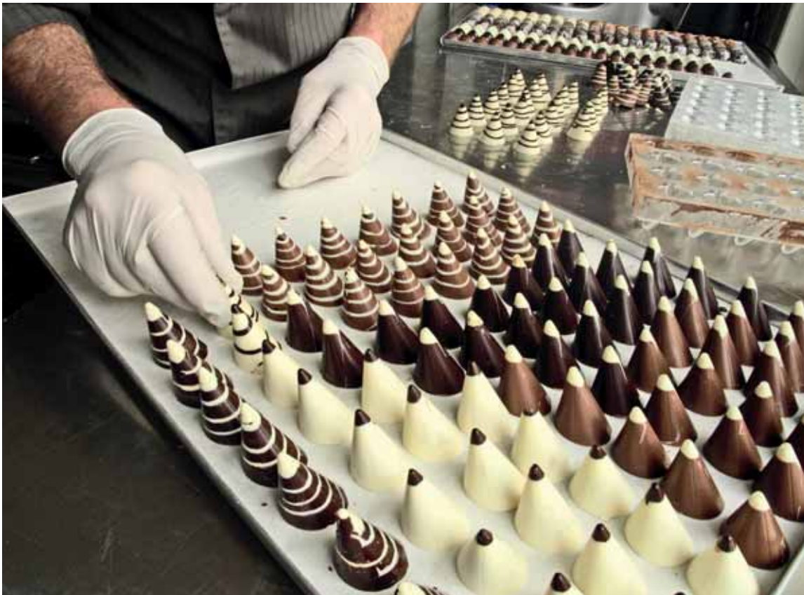
Казахстанцы третий год отстаивают право сладкого продукта на натуральность.

В основном это горнодобывающие предприятия. По словам министра, сейчас неизвестно, сколько человек в результате модернизации останется за бортом, но эти риски поручено акимату Костанайской области просчитать, и как можно быстрее. Пока предлагаемое решение – помочь этим людям получить новые специальности.