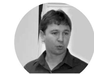
«Школы скрывают от людей реальные возможности фонда всеобуча».

Закон РК «Об образовании» предписывает полностью или частично компенсировать расходы на содержание детей, нуждающихся в поддержке во время получения образования. Оказание материальной помощи из фонда за счет бюджетных средств – одна из форм. «Для обеспечения правильного распределения средств из фонда всеобуча при общеобразовательном учреждении создается комиссия в количестве трех-пяти чело-