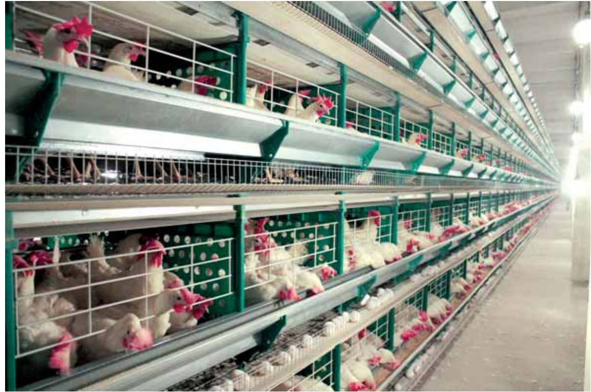
Птицефабрика в Рудном планирует построить оцифрованный племенрепродуктор.

Костанайская область погрузилась в пилотный проект по использованию новых технологий