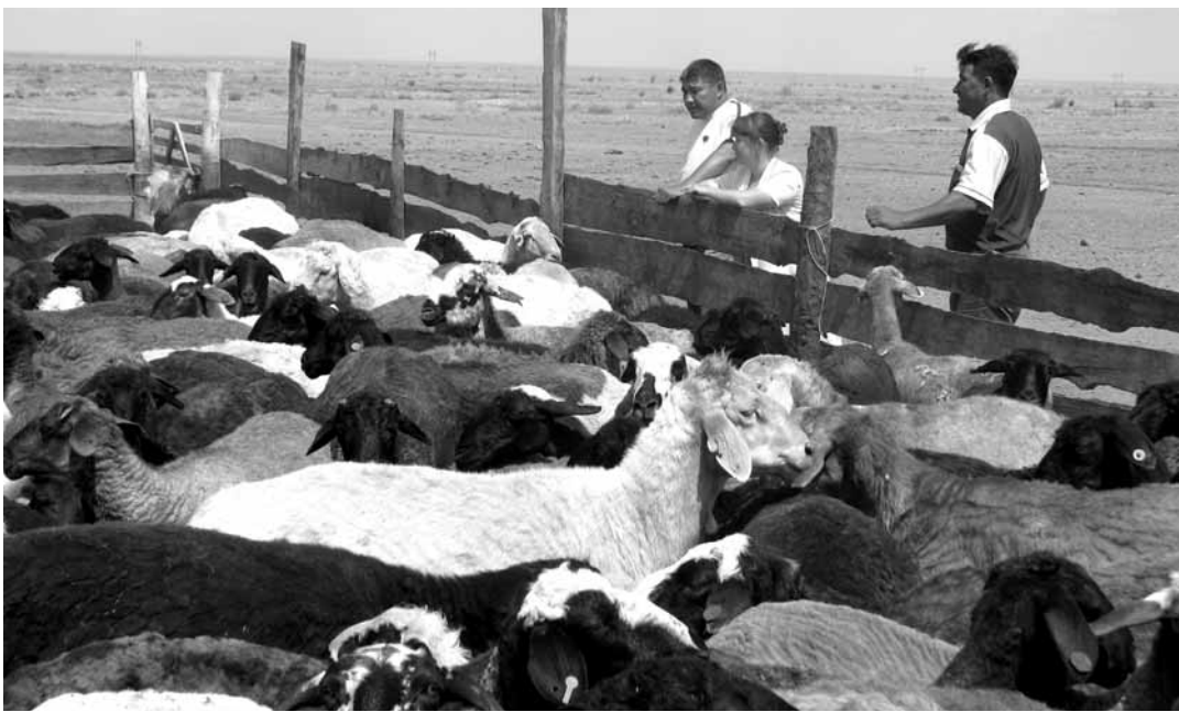
Завод по глубокой переработке шерсти будет включать в себя все этапы производства – от заготовки и селекционной работы с МРС до выпуска топса и овечьего пуха на экспорт.

Предприниматель планирует открыть свои заготовительные пункты в районах Восточного Казахстана и