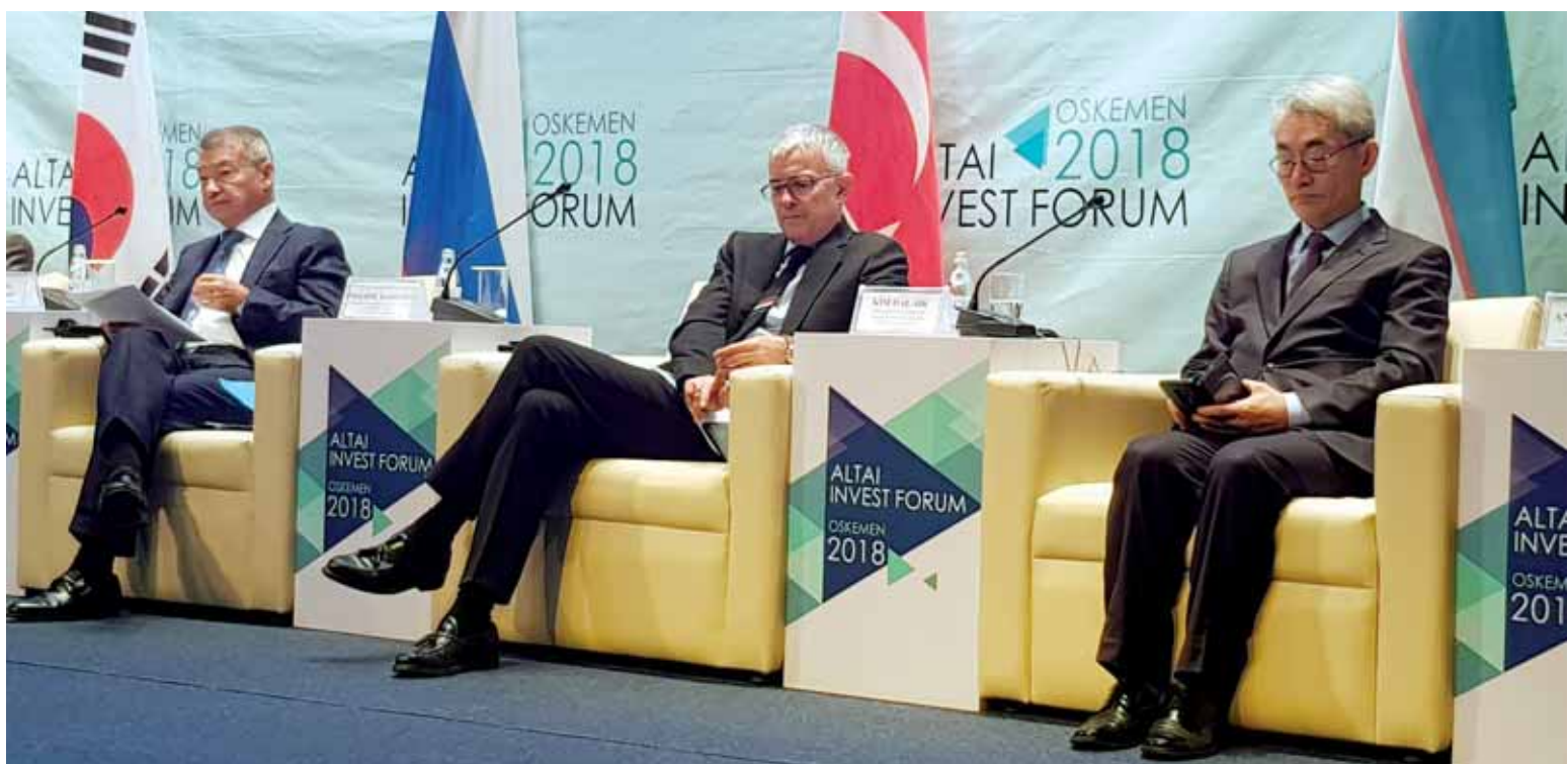
Большинство проектов инвестиционного форума 2016 года еще в стадии разработки. На сегодня реализовано лишь 8 проектов.

Наиболее крупные из них – это строительство: ТЭЦ-3 в Семее (163 млрд тенге); мостовых переходов через реку Иртыш в Усть-Каменогорске (62 млрд тенге) и через Бухтарминское водохранилище в Курчумском районе (30 млрд тенге); мясоперерабатывающего комплекса в Аягзском районе (4,5 млрд тенге); бройлерной птицефабрики мощностью 30 тыс. т мяса в год в Урджарском районе (36 млрд тенге); завода по про-