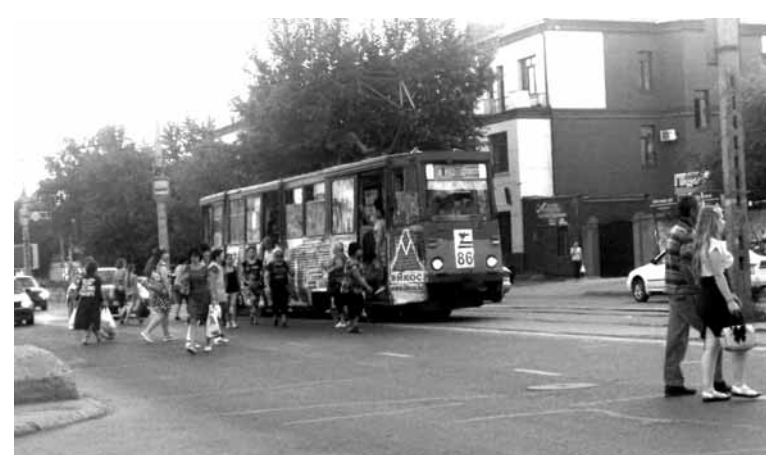
«Старые новые» трамваи в Усть-Каменогорске часто выходят из строя.

Одной из причин многочисленных остановок, поломок, сходов с линий «старых новых» трамваев руководство транспортного предприятия называет плохое состояние всей инфраструктуры трамвайного хозяйства. Капитального ремонта требуют шесть километров трамвайных путей. Восемь километров контактных сетей нужно полностью менять. Также обновления требует само депо. На техническое перевооружение, которое не делали более 20 лет, требуются колоссальные затраты. При посещении акимом ВКО Даниалом Ахметовым трамвайного парка в мае этого года была озвучена такая цифра – 2,2 млрд тенге. Известно, что модернизация имущественного комплекса трамвайного парка будет производиться поэтапно.