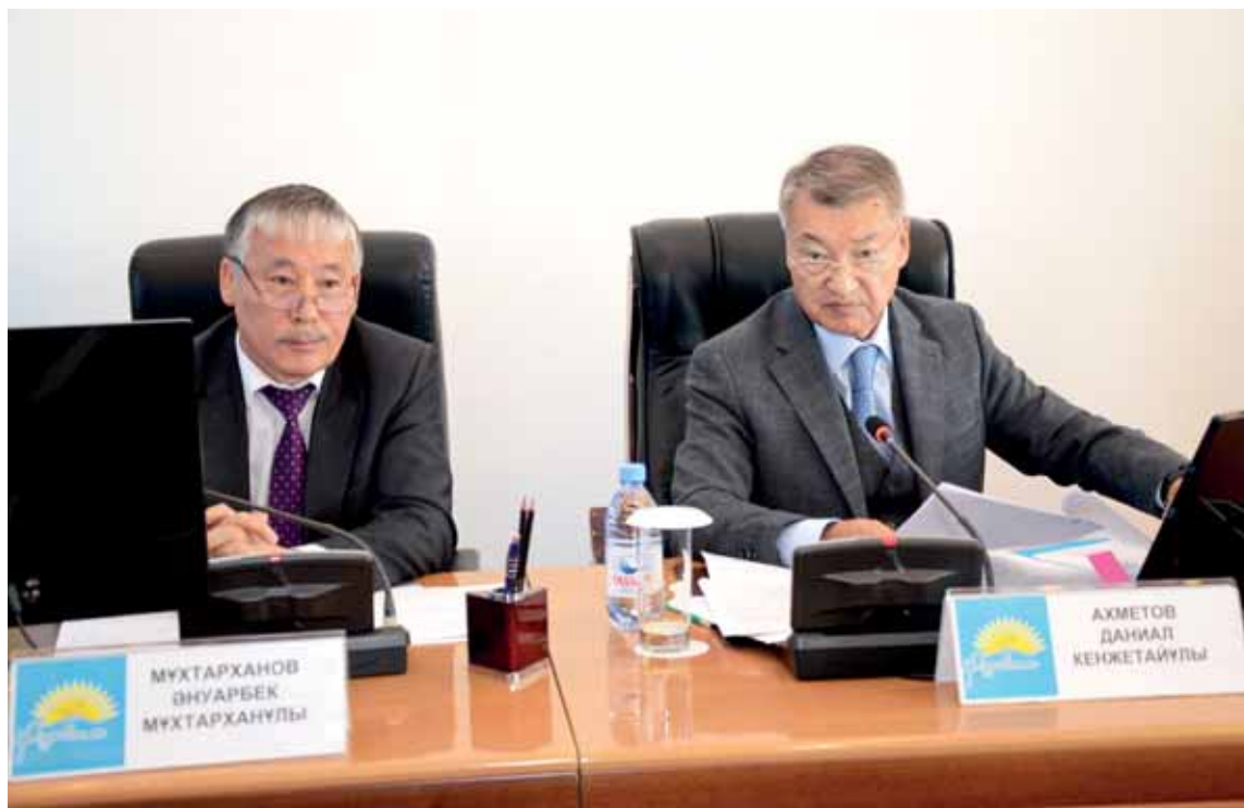
Глава ВКО Даниал Ахметов поручил акимам районов проработать с каждым жителем вопрос подключения к центральному газоснабжению. Срок завершения газификации был перенесен еще на месяц.

По словам руководителя областного управления энергетики и жилищно-коммунального хозяйства Мурата Муздыбаева, только на две проектно-сметные документации