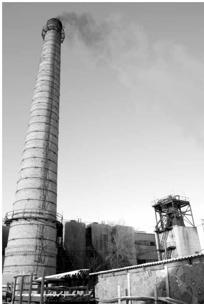
Семей отапливается мелкими котельными.

В 2015 году акимат ВКО и турецкая компания ТОО «Unit energy investment» подписали договор намерений. А Министерство инвестиций и развития РК под-