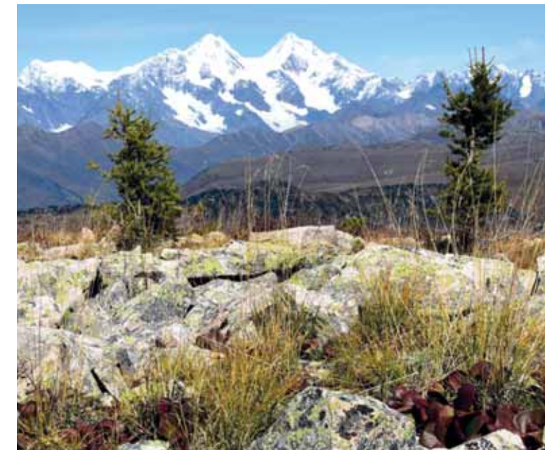
Потенциал Катон-Карагайского района позволяет развивать различные виды туризма.

В последние годы информация о районе, его санаториях и базах отдыха появилась на многих туристических сайтах. Активизирован внутренний туризм. Но это только первые шаги. Владельцы гостевых домов отмечают, что реальный вклад в экономику туризм начнет вносить, если турпоток возрастет, как минимум, в несколько раз.