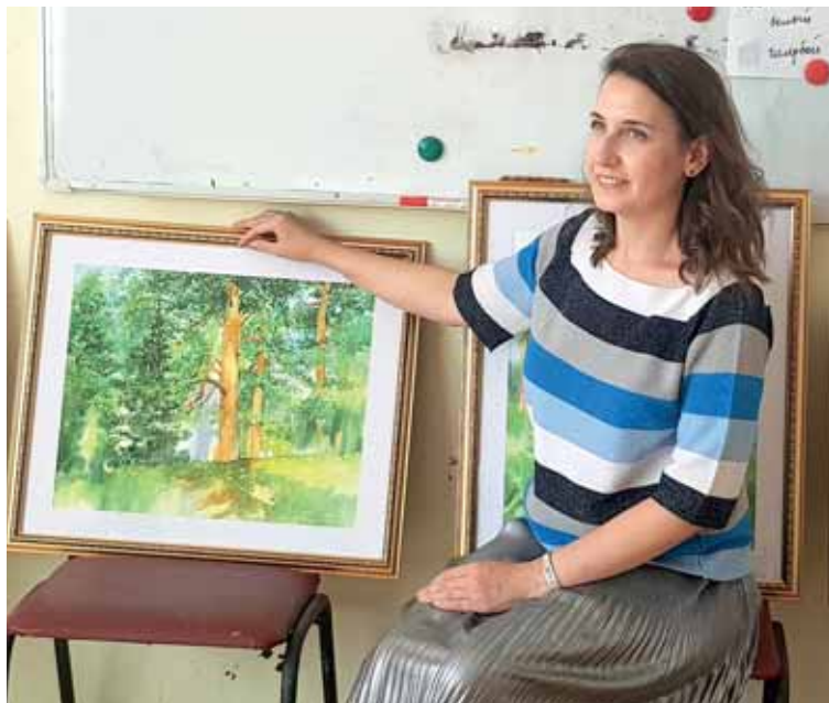
Творчество пока востребовано только... за рубежом. В среднем холсты продаются за цену от 185 до 500 тыс. тенге. И покупатели искренне не понимают, как рисунок на бумаге может столько стоить.

«Нельзя сказать, что не покупают портреты или достопримечательности, но конъюнктурные работы берут охотнее. Есть и те картины, что продавать не хочется, потому что они связаны с какими-то жизненными событиями, на фоне которых эта картина была написана. Вообще художник проецирует свои переживания на холст, и в его работе, вне зависимости от того, что изображено на полотне, так или иначе присутствует какое-то его жизненное событие. Поэтому, несмотря на развитие цифровых технологий, до сих пор очень ценятся картины, написанные от руки. Суммы за некоторые полотна доходят до нескольких миллионов долларов. Искусство всегда в цене», – рассказывает она.