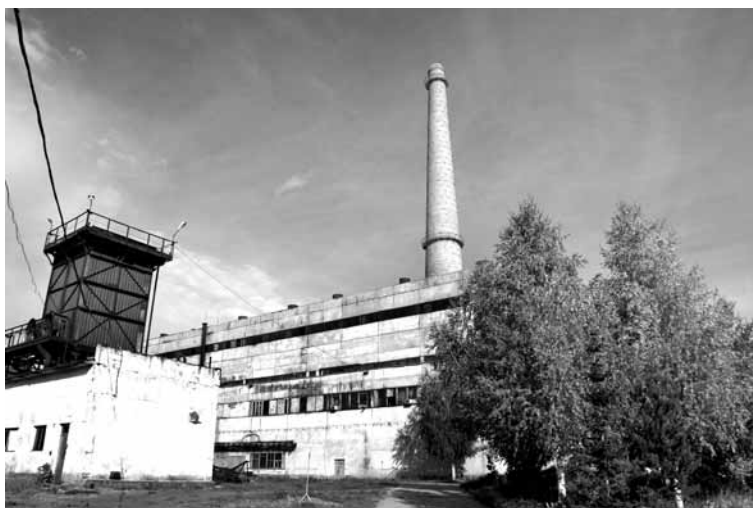
Чтобы переоборудовать районную котельную в мини-ТЭЦ, необходимо 2,6 млрд тенге.

Шанс на реализацию нужного проекта появился благодаря включению Зыряновска в список моногородов. Финансирование было одобрено в рамках Программы развития регионов до 2020 года. В 2012 году на объект зашел генпродюсер, ТОО «Компания Отау Ку-