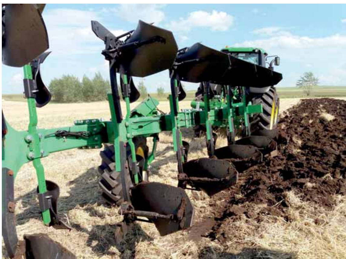
Кустарные запчасти, закупаемые на рынках, нередко становятся причиной поломки сельхозтехники во время сбора урожая.

В КХ «Ер-Али» Жалагашского района 1400 га риса. Скошено уже 1200, обмолочено 1000 га. Жатву здесь начали позже обычного – из-за того, что рис поздно созрел. Уборка риса началась 28 сентября, но хозяйство уже не раз меняло на технике ремни, подшипники и другие запчасти. Покупали их на рынках, где цены поднимаются два раза в год: весной, когда идет посевная, и летом, когда начинается жатва.