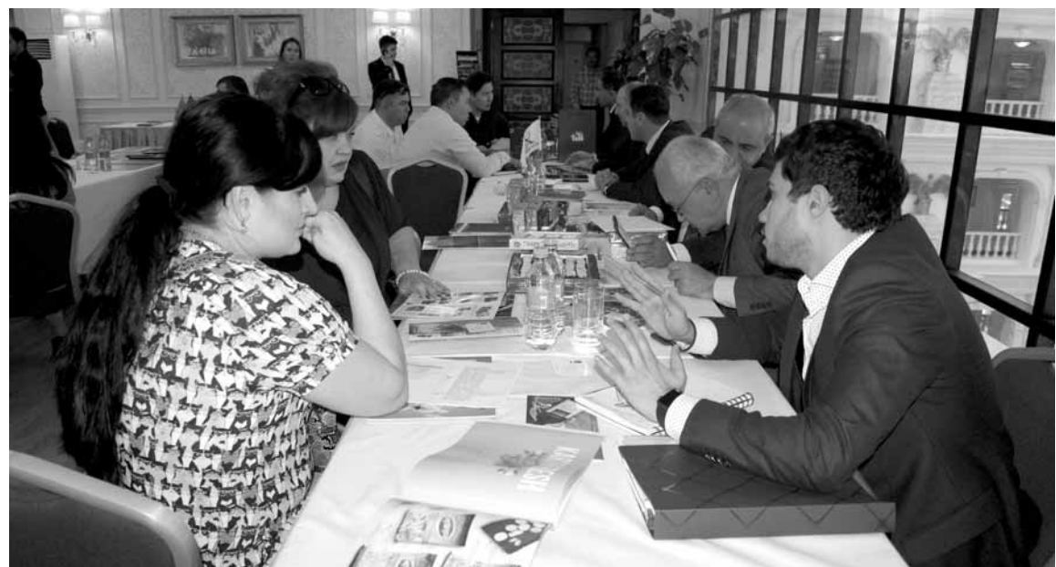
Представители почти трех десятков компаний из Азербайджана прибыли в Шымкент в поисках партнеров.