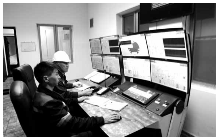
В 2018 году руководство завода намерено привлечь инвестиции в размере 12 млрд тенге.

Как отметили участники, подобные двусторонние встречи полезны и в плане маркетинговых исследований. Так, представители азербайджанских компаний смогли не только пообщаться с потенциальными партнерами, но и совершить экскурсию по торговым точкам Шымкента. Обехав их, гости получили наглядное представление о том, какими товарами наполнен местный рынок и действующей на нем ценовой политике.