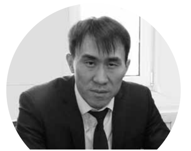
«С начала текущего года выявлено 19 фактов хищения средств, выделенных только по программе «Дорожная карта занятости населения-2020».

По его словам, сотрудникам АО «Досжантемиржолы» было предложено начать ремонтировать полотно,