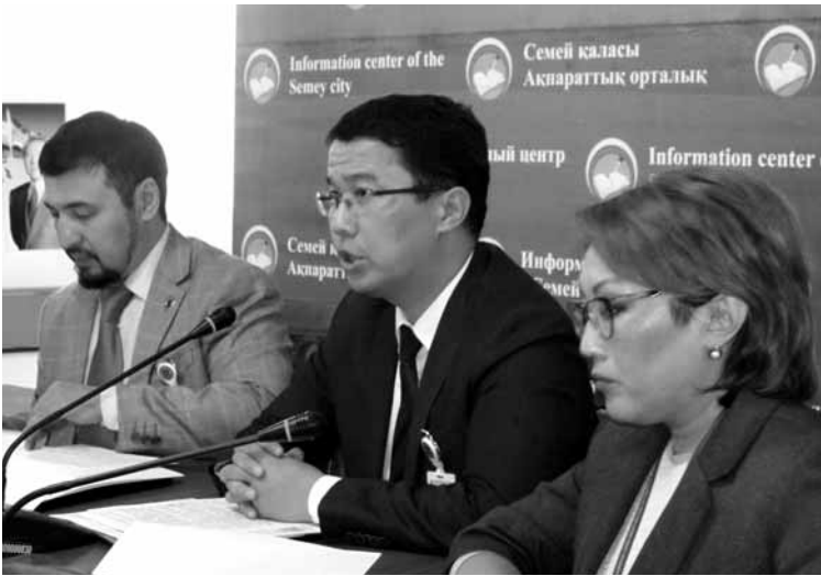
По словам экспертов, повышение зарплат резко сократило уровень увольнения специалистов с государственной службы.

«С 2019 года заработная плата государственных служащих будет состоять из двух частей. Это фиксированная и переменная части. Так, фиксированная часть станет начисляться на основе специальной разработанного реестра, учитывающего степень знаний и компетенций каждого специалиста. Ну а переменная часть, или бонусы, будет выплачиваться в конце года и высчитываться по годовым итогам работы конкретного государственного служащего. То есть это будет премия, эквивалентная оценке его