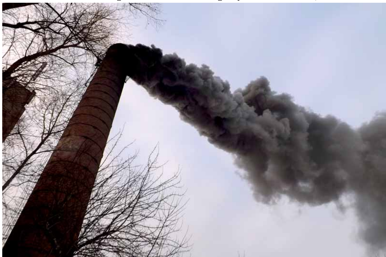
Из-за управленческих ошибок 96 млн тенге вылетели для тепловиков в трубу.

«Благодаря собственной выработке электроэнергии, у предприятия образовалась экономия. Если бы руководство своевременно обратилось к нам с этим вопросом, мы бы смогли на законных основаниях провести корректировку тарифной сметы и пустить сэкономленную сумму на другие нужды этой же компании. Ведь сегодня в «Теплокоммунэнерго» не хватает на приобретение угля