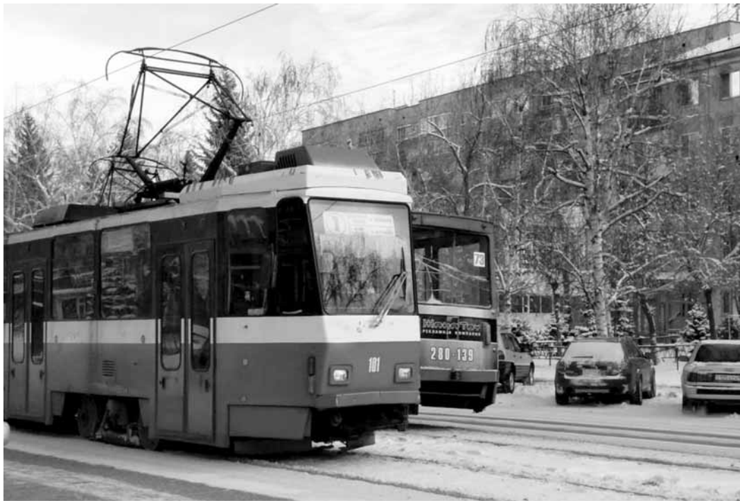
Более 620 млн тенге был долг транспортной компании.

Информация о том, что трамвайный парк снова в кризисе, появилась на днях. «В настоящее время у ТОО «Транспортная компания Усть-Каменогорска» действительно образовалась задолженность. В договоре доверительного управления было изначально прописано, что ТОО должны ежемесячно выплачивать корпорации «Ертіс» 64 млн тенге. СПК должна иметь определенную прибыль со своего имущества. Но сейчас с этим вопросом разобрались. Трамвайный парк – убыточная компания, того, что она зарабатывает, хватает только на зарплату сотрудникам», – сообщил в ответ на вопрос «Къ» руководитель Управления пассажирского транспорта и автомобильных дорог ВКО Нуржан Жумадилов.