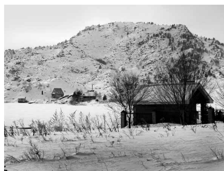
Согласно ст. 92 и ст. 94 Земельного кодекса РК, владельцу сначала дают предписание использовать участок в течение года.