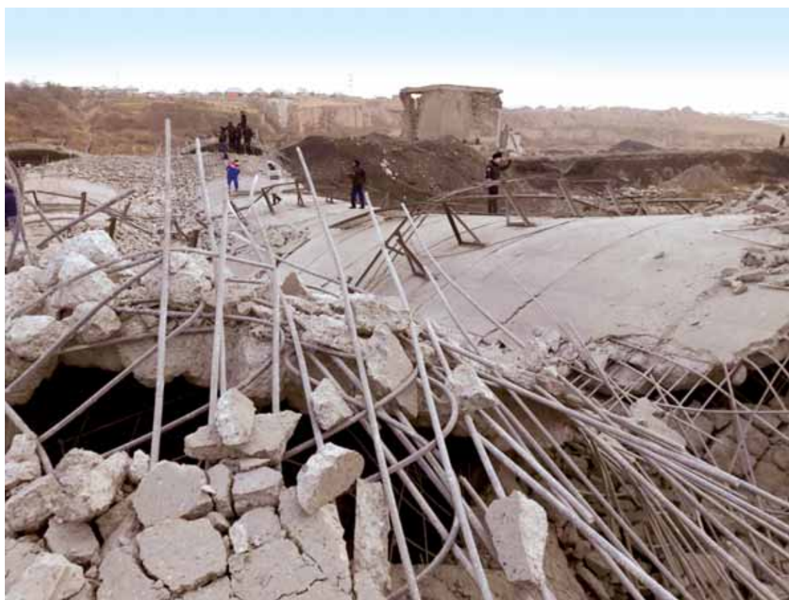
Подпиленная мародерами труба представляла опасность, так как могла рухнуть и вызвать землетрясение техногенного характера.

Гигантское строение из армированного бетона оказалось в буквальном смысле подточенным сборщиками металла. Они разрушили бетон с одной стороны так,