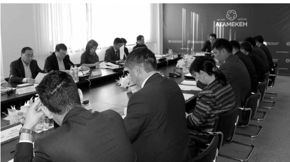
Почему в ряде школ Кызылорды частникам не дали открыть стоматологические кабинеты, разбирались на совете по защите прав предпринимателей и противодействию коррупции при Палате «Атамекен».

Как выяснили эксперты и юристы палаты предпринимателей, при приеме заявок участников диагностический центр направил в отдел финансов письма о предоставлении на безвозмездное временное пользование нежилые помещения в 12 средних школах Кызылорды для оказания стоматологической помощи в рамках гарантированного объема бесплатной медицинской помощи. Они неоднократно рассматривались на заседаниях комиссии по передаче коммунального имущества Кызылорды в имущественный наем. В итоге тендер был отменен. «Диагностический центр как государственное предприятие на