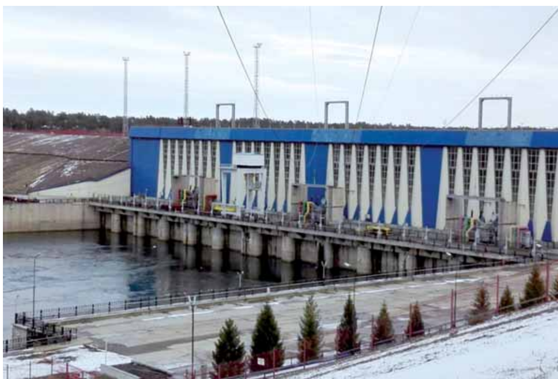
По информации генпрокуратуры РК, за 2015–2016 годы компания AES вывела за границу дивиденды на сумму 22 млрд тенге.

Как указывается в судебных документах, иск был подан ввиду нарушения Казахстаном прав AES и привилегий «инвестора» согласно Закону РК «Об иностранных инвестициях», двустороннему