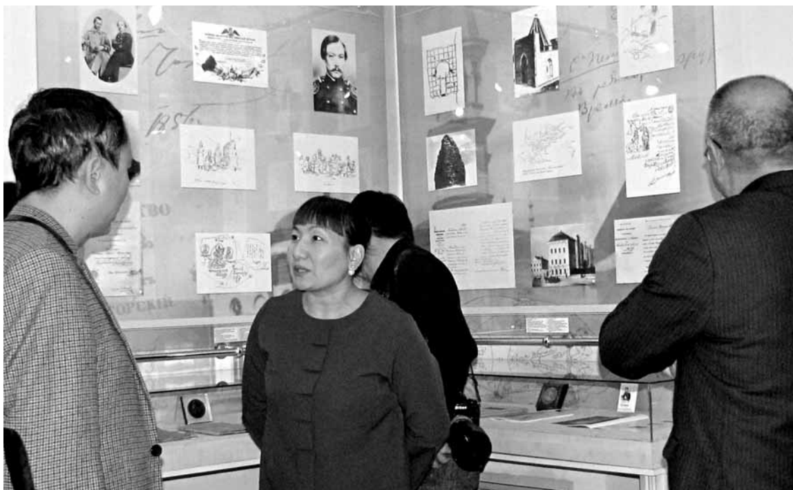
Полтора века прошло, а вклад в науку, сделанный Чоканом Валихановым, до сих пор вдохновляет современных исследователей.

Прозвали его так за напористость в делах, деловую хватку и