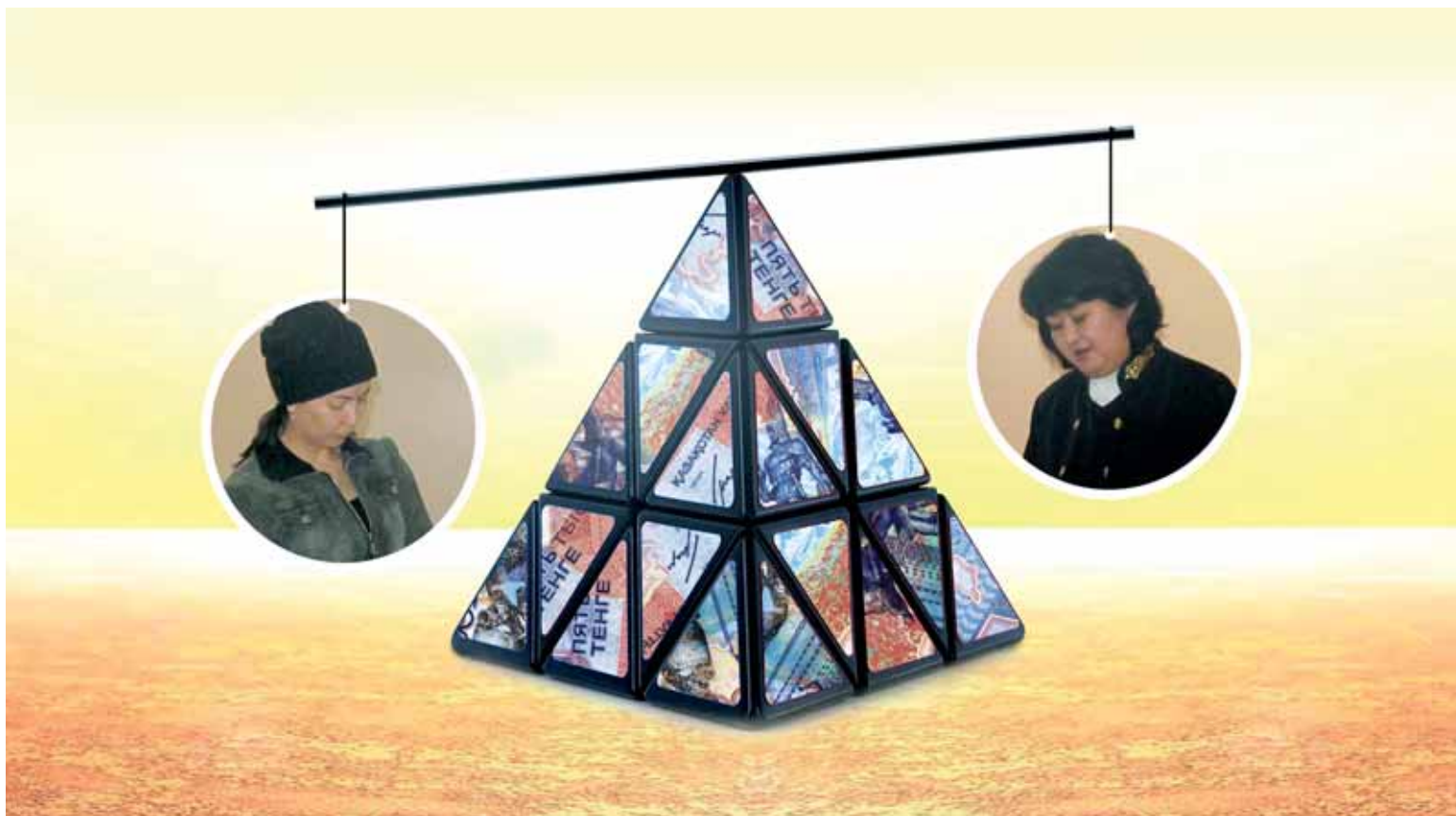
420 потерпевших сумели доказать суду, что обвиняемая обманом присвоила их деньги на сумму более 69 млн тенге.

И первоначально видимость того, что кредиты клиентам исправно погашаются в банках, присутствовала. За счет привлечения все новых и новых клиентов часть суммы шла на погашение кредитов первых вкладчиков. А вот основная прибыль выводилась из компании.