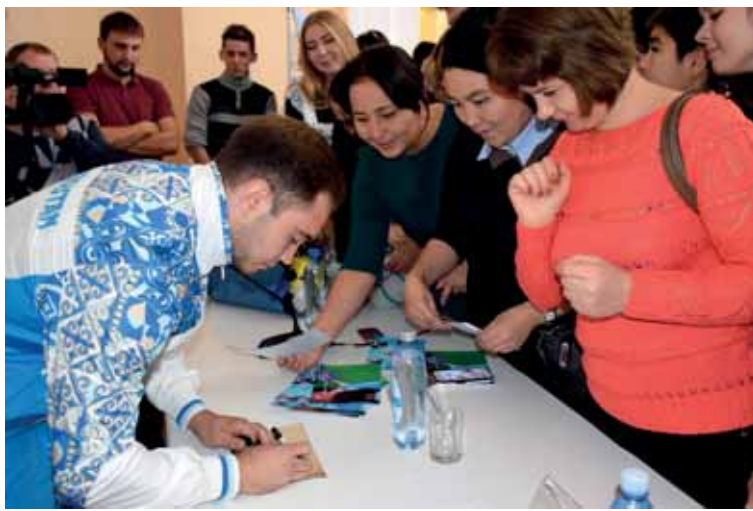
Бронзовый призер Олимпийских игр может уйти в политику.