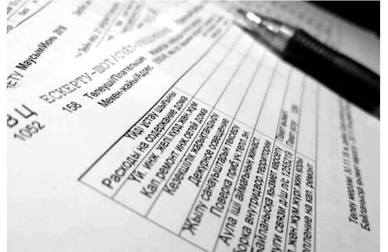
ТОО «Казахстанский центр нормирования отходов» пересчитало тариф: для многоквартирных домов – 284,6 тенге с человека, 331 тенге с человека в частных домах и 1180 тенге – с юрлиц.

Вопросов по этой теме скопилось столько, что общественники решили тщательно проработать все позиции, для чего была собрана рабочая группа. На недавнем совместном заседании членов Общественного совета и специальной мониторинговой группы города были озвучены результаты