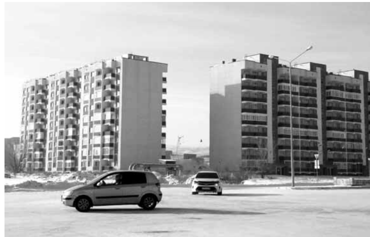
Жители 19-го жилого микрорайона Усть-Каменогорска жалуются на подтопления грунтовыми водами.

Отвечая на вопрос «Къ», проводится ли перед началом строительства инженерно-изыскательные работы на выбранных участках, заместитель руководителя отдела