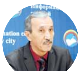
«Было внесено предложение увеличить заработную плату на всех предприятиях внебюджетной сферы».

В настоящее время отделом занятости и социальных программ ведется работа по 9 932 городским предприятиям, 35 из которых – крупные, из этих больших организаций три уже подняли зарплату своим сотрудникам. Остальные еще только готовятся к предстоящим изменениям. Добросовестные и законопослушные бизнесмены занимаются финансовыми расчетами и ищут пути повышения зарплат таким способом, чтобы не пришлось сокращать штаты. Ну а кто-то давно нашел лазейки, позволяющие избежать излишних затрат.