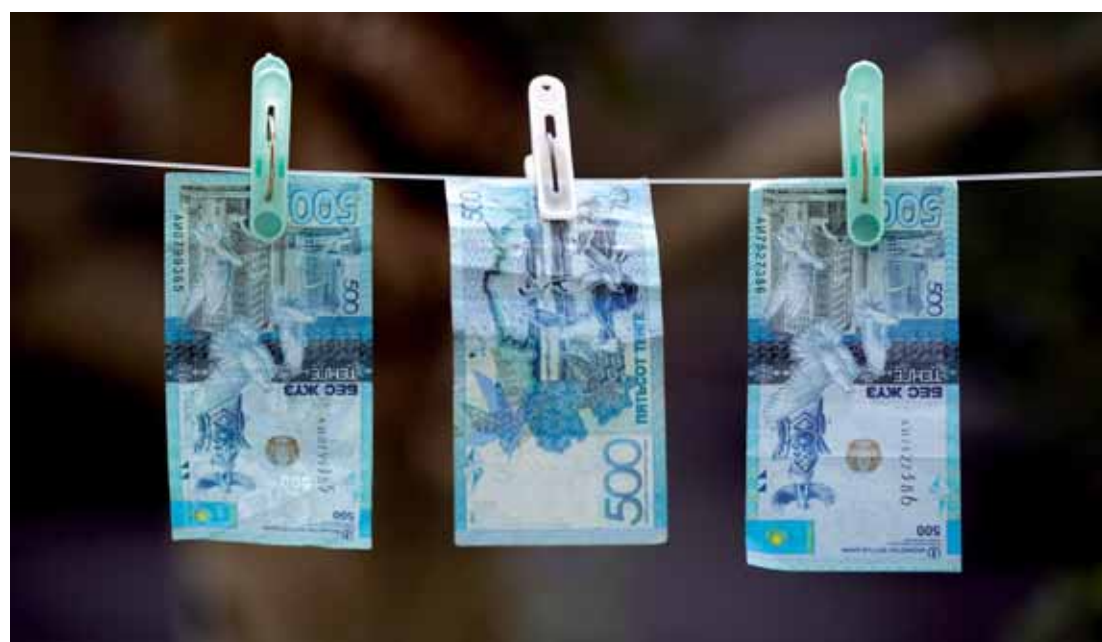
Представители бизнеса, профсоюзов и акиматов в Восточном Казахстане подписали соглашение о повышении заработной платы низкооплачиваемым работникам на 10% в 2019 году.

По его словам, на специальном заседании трехсторонней комиссии, в которую входят представители палаты предпринимателей, профсоюзов и акиматов, в Восточном Казахстане было подписано соглашение о повышении