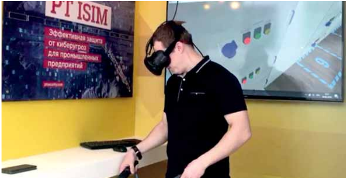
Надев очки виртуальной реальности, можно оказаться в «горячем» цеху.

Для того чтобы персонал крупных предприятий лучше понимал производство, обучался действовать в непредвиденных ситуациях и непрерывно совершенствовал свое мастерство, одна из инжиниринговых компаний региона, расположенная в Усть-Каменогорске, «построила» цифровые двойники заводов, обогатительных фабрик и прочих гигантов промышленности. Надев очки виртуальной реальности, любой оператор производства может прогуляться по цехам и проверить работу того или иного оборудования, не выходя из своего центра управления или офиса. С технической стороны процесс достаточно сложен, но