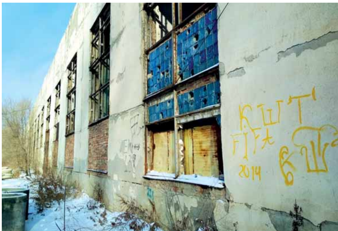
От знаменитого Комбината шелковых тканей Усть-Каменогорска остались только граффити на стенах заброшенных цехов и миллиардные долги перед кредиторами.

Несмотря на рост объемов финансирования в сфере жилищного