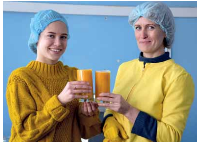
Производство тыквенного сока помогло наладить взаимопонимание между двумя поколениями.

Танцоры приготовили полторы тонны тыквенного сока