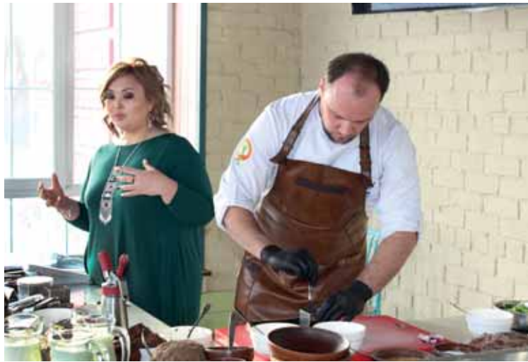
Тартар из конины и курдючное сало в бруснике, по мнению шеф-поваров, поменяют представление о национальной кухне.

«Мы объездили почти всю область и нам удалось найти рецепты 25 давно забытых блюд. Все они очень разные. Интересные рыбные блюда мы изучили в Курчумском и Маркакольском районах ВКО, помнит их рецептуру и способ приготовления одна бабушка на всю деревню. Например, такое блюдо, как «мекре». В нем используются мясо рыбы и конская жирная кашка. Получается очень интересная холодная закуска. Мы