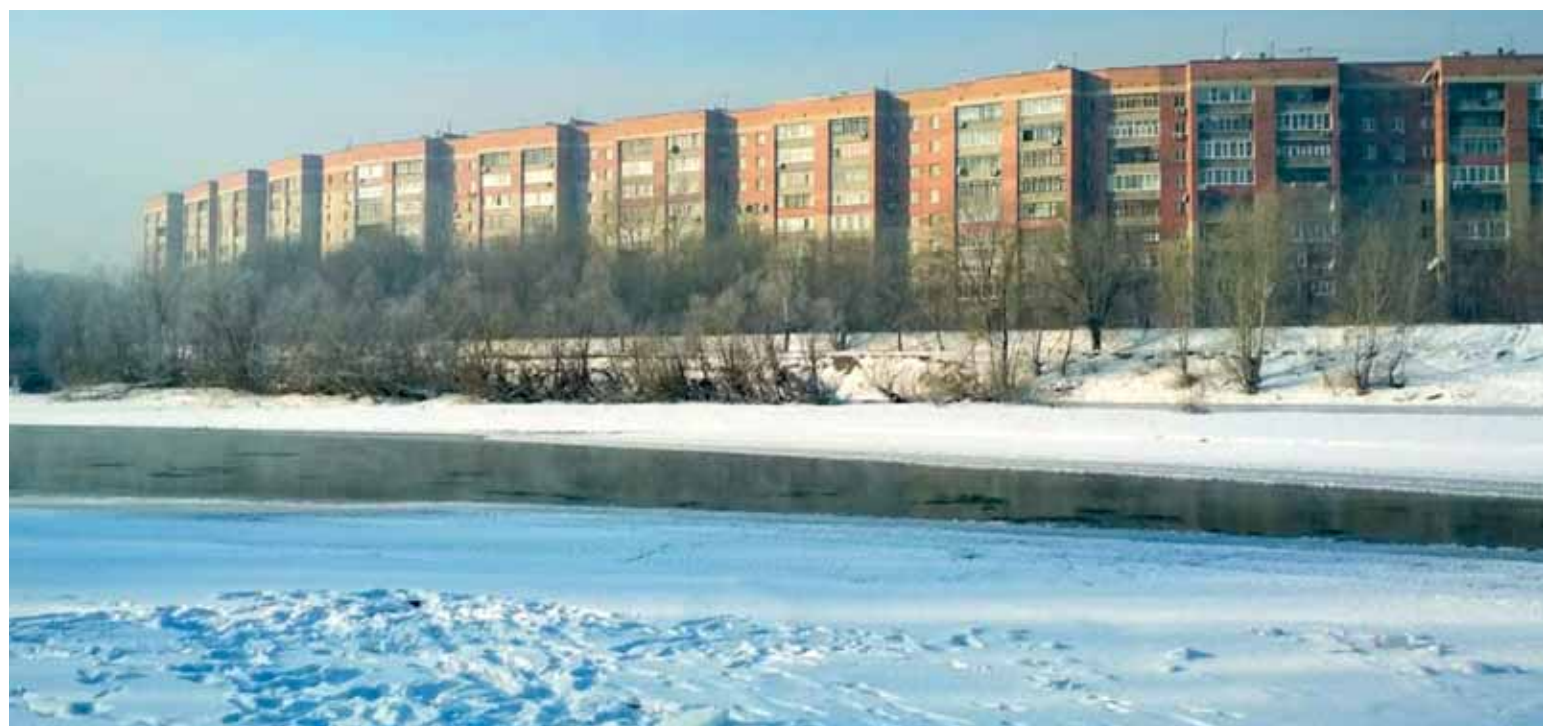
Ульба признана рекой высокого уровня загрязнения. Содержание в ее водах меди, марганца и цинка выше нормы в 3–9 раз.