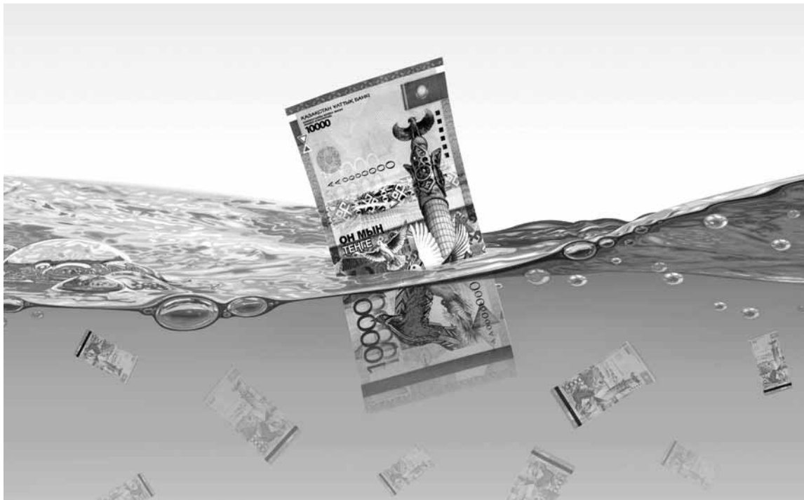
До сих пор остается загадкой, какая именно сумма поступила на счет благотворительного фонда за всю историю его существования. Коллаж: Вячеслав БАТУРИН

Некоммерческая организация закрылась всего два месяца назад, хотя события, спровоцировавшие ее создание, произошли еще в апреле 2015 года. К ныне уже не существующей благотворительной структуре остается немало вопросов, ставших под сомнение разумность перечисления в прошлом на ее счет денежных средств.