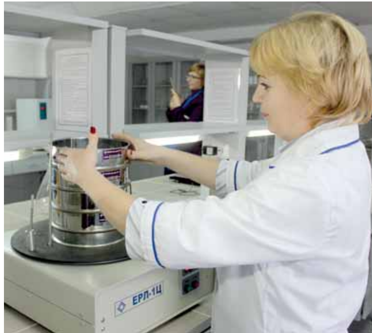
Инвесторы наладили производство муки, глютена, крахмала и кормов для животных. В перспективе, из некондиционной пшеницы в Казахстане будут делать биоэтанол.

Инвесторы планируют организовать в Тайыншинском районе мощный сельскохозяйственный