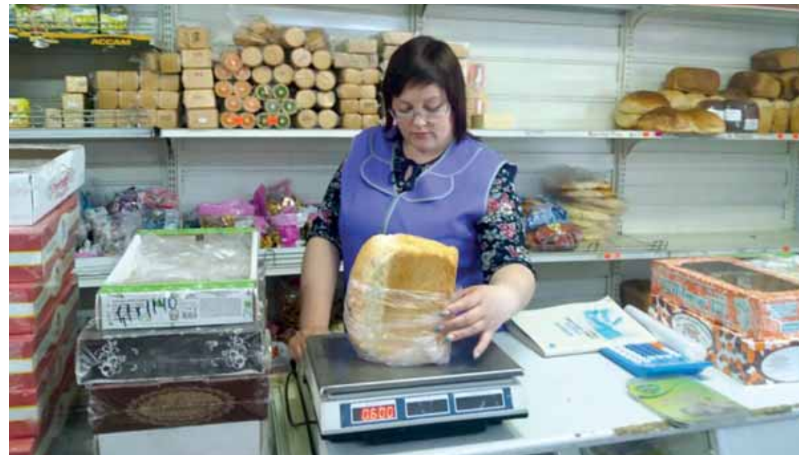
Буханка алтайского хлеба весит 600 граммов, привозного — 500 граммов при равной цене.