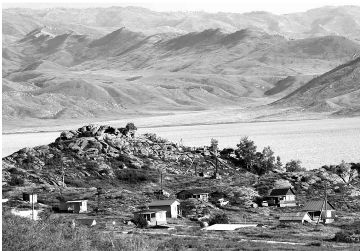
Цены домов на Бухтарминском водохранилище доходят до 110 млн тенге.

По данным Анастасии Рыженковой, стоимость дома зависит не только от состояния самой постройки, но и от близости пляжа, инфраструктуры, размеров земельного участка. Пока, по информации риелтора, большинство покупателей предпочитают брать