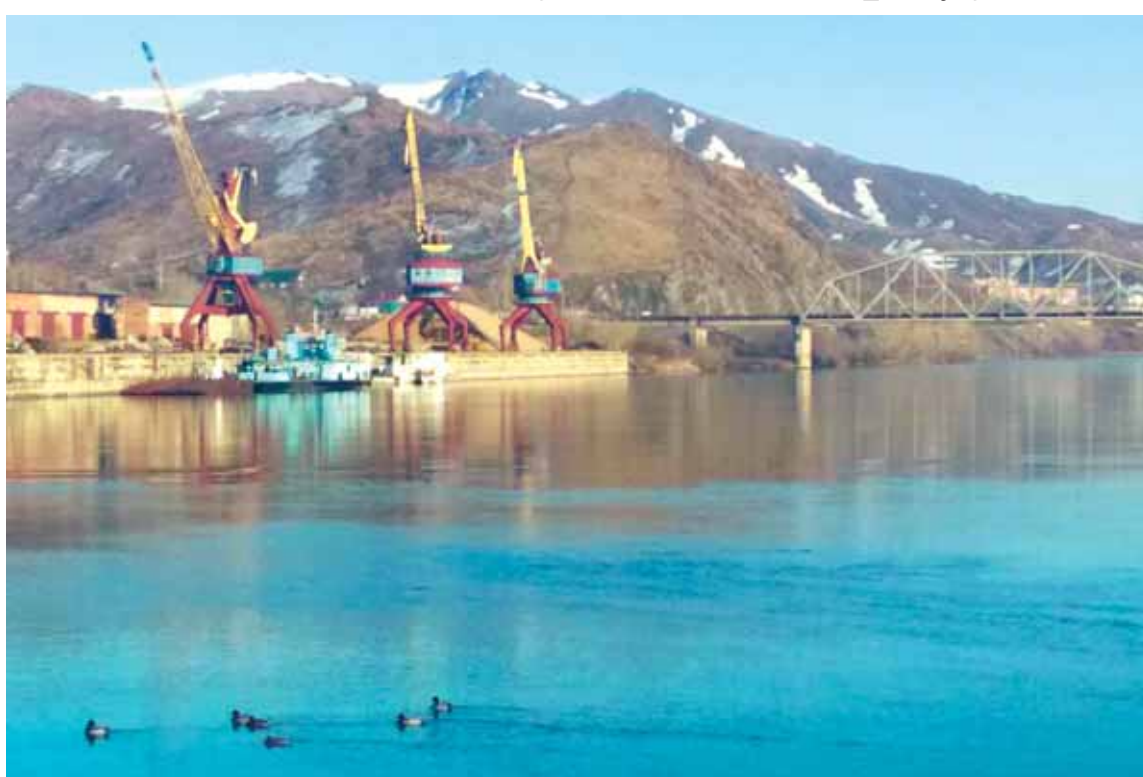
По данным Комитета по водным ресурсам МСХ РК, в настоящее время в Китае происходит увеличение объема забора вод Черного Иртыша. Сможет ли Казахстан отстоять свои позиции — тот еще вопрос.

Судя по доступной информации, поступающей из Поднебесной, вла-