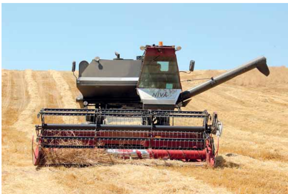
По программе «ЫРЫС-ӨРКЕНДЕУ» рыночная стоимость техники при закупке ее от производителей снизится на 20%.