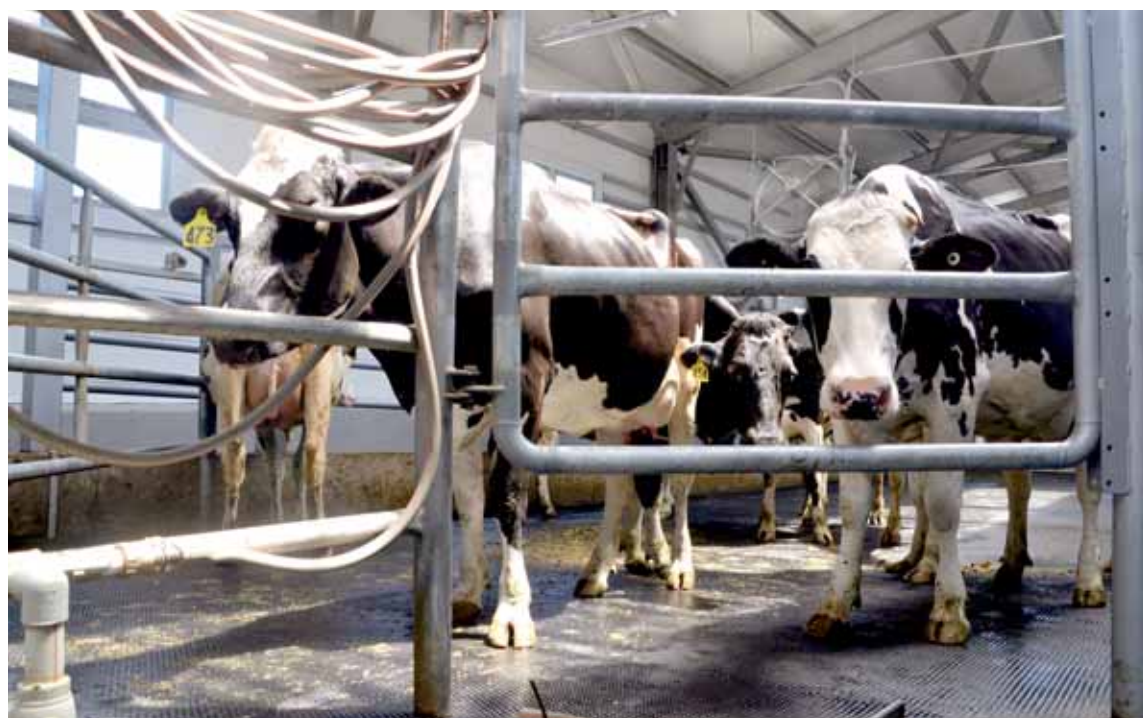
Подделывать бирки, которые прикрепляют на уши коровам и быкам, невозможно, говорят специалисты. Каждая бирка имеет свой номер и вносится в базу ИСЖ.

Выясняется, что в предпринимательской среде бытует мнение, что подделывать документы на животных возможно. Как объяснили предприниматели, каждому животному присваивается индивидуальный