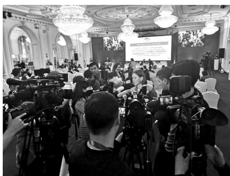
МИД РК с 1 января 2017 года расширил список стран с безвизовым въездом в Казахстан сроком до 30 дней для 35 стран ОЭСР.

Однако при этом он все же признает, что на сегодня узнаваемость Узбекистана несколько выше, чем у Казахстана. Поэтому нам необходимо обеспечить хороший информационный посыл на международный рынок. И здесь Узбекистан может сыграть роль локомотива. «Когда человек по-