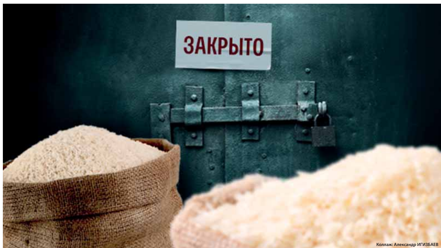
Коллаж: Александр ИГИЗБАЕВ

Сегодня завод производит до 700 тыс. мешков в месяц, или 8,4