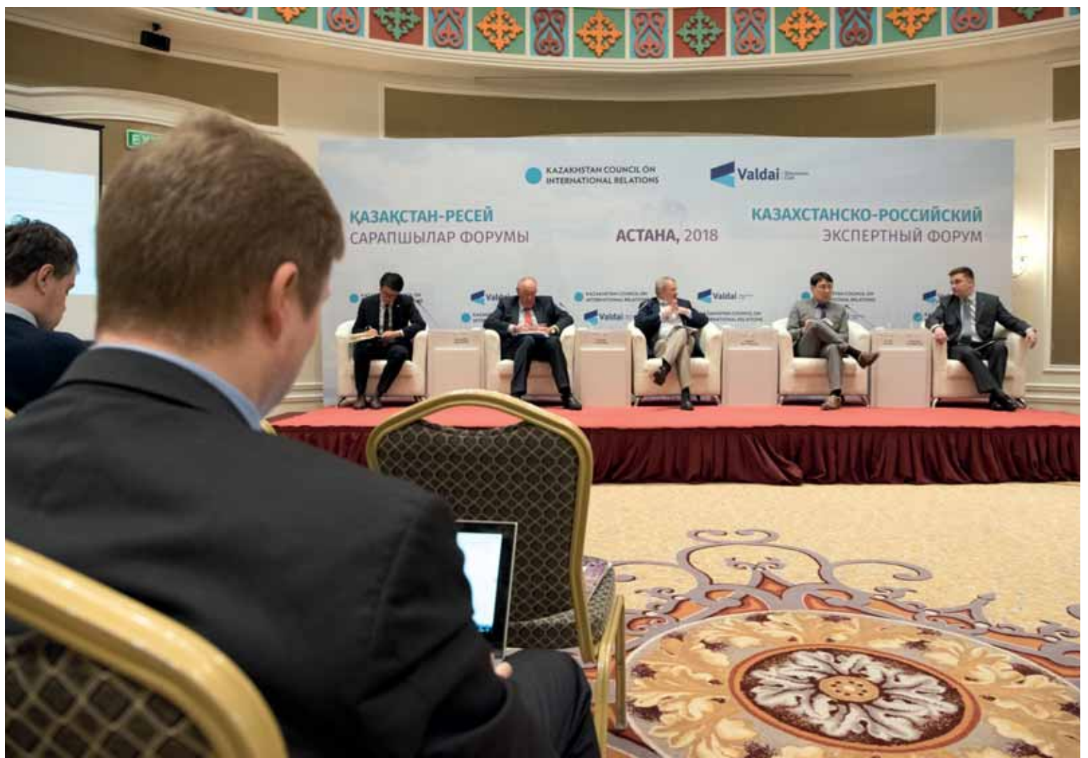
По мнению политологов, для Казахстана стоит вопрос, как мы себя позиционируем: как центральноазиатская общность или все же как общность евразийская?