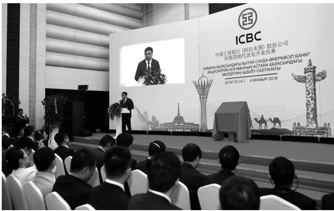
Компании Поднебесной уверенно заходят в финансовый сектор Казахстана.

В настоящее время биржа работает с Industrial and Commercial