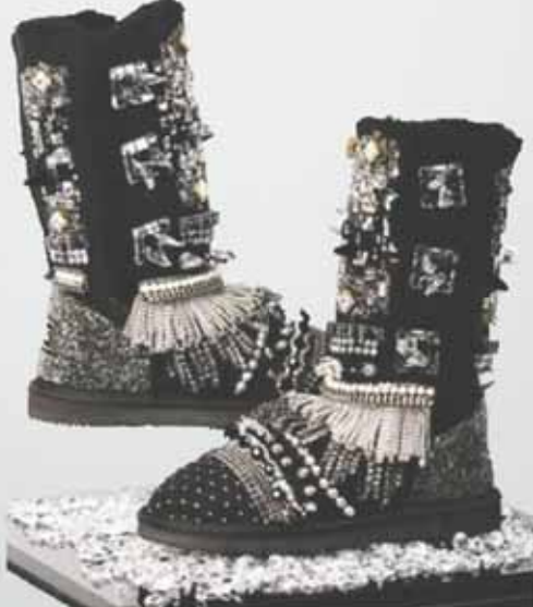
Модель UGG, расписанная языками пламени, за $1195