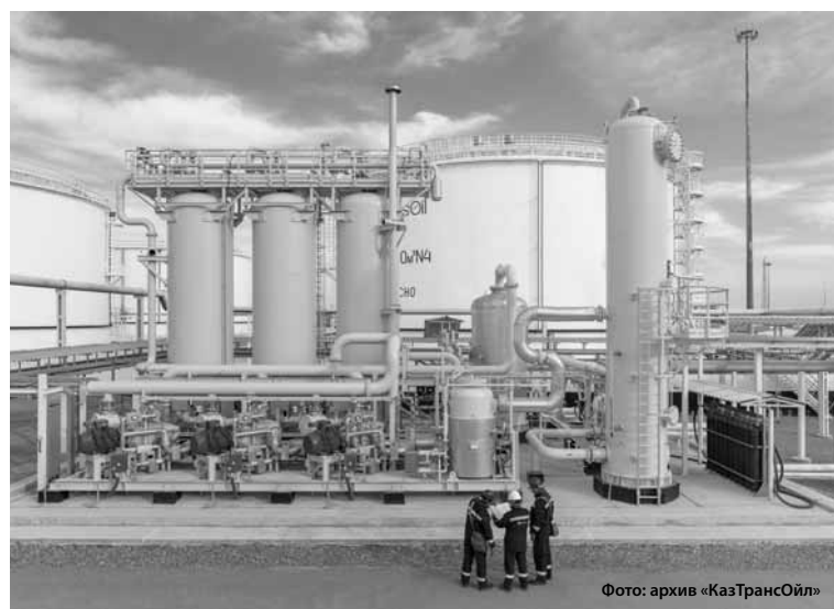
Установка рекуперации паров на НПС им. Н. Шманова Атырауского нефтепроводного управления.