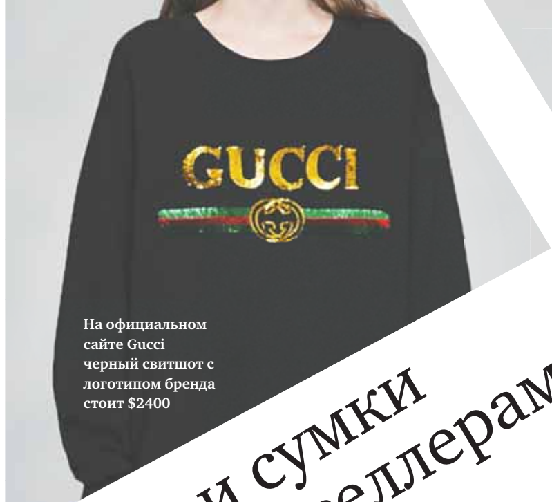
На официальном сайте Gucci черный свитшот с логотипом бренда стоит $2400