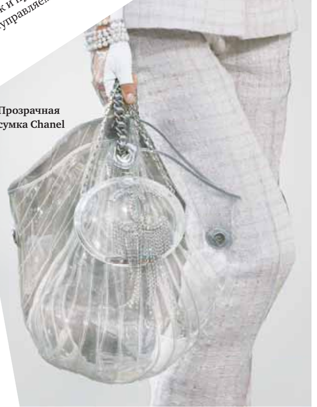
Прозрачная сумка Chanel