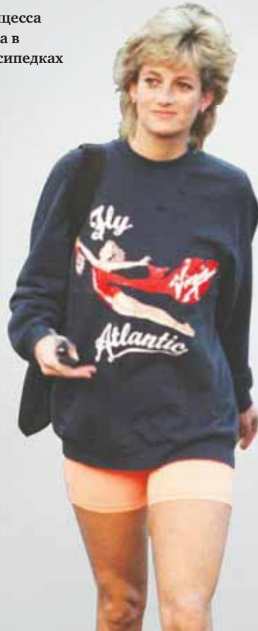
Принцесса Диана в велосипедках