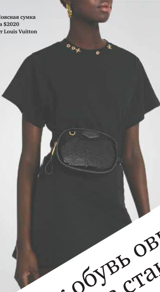
Поясная сумка за $2020 от Louis Vuitton