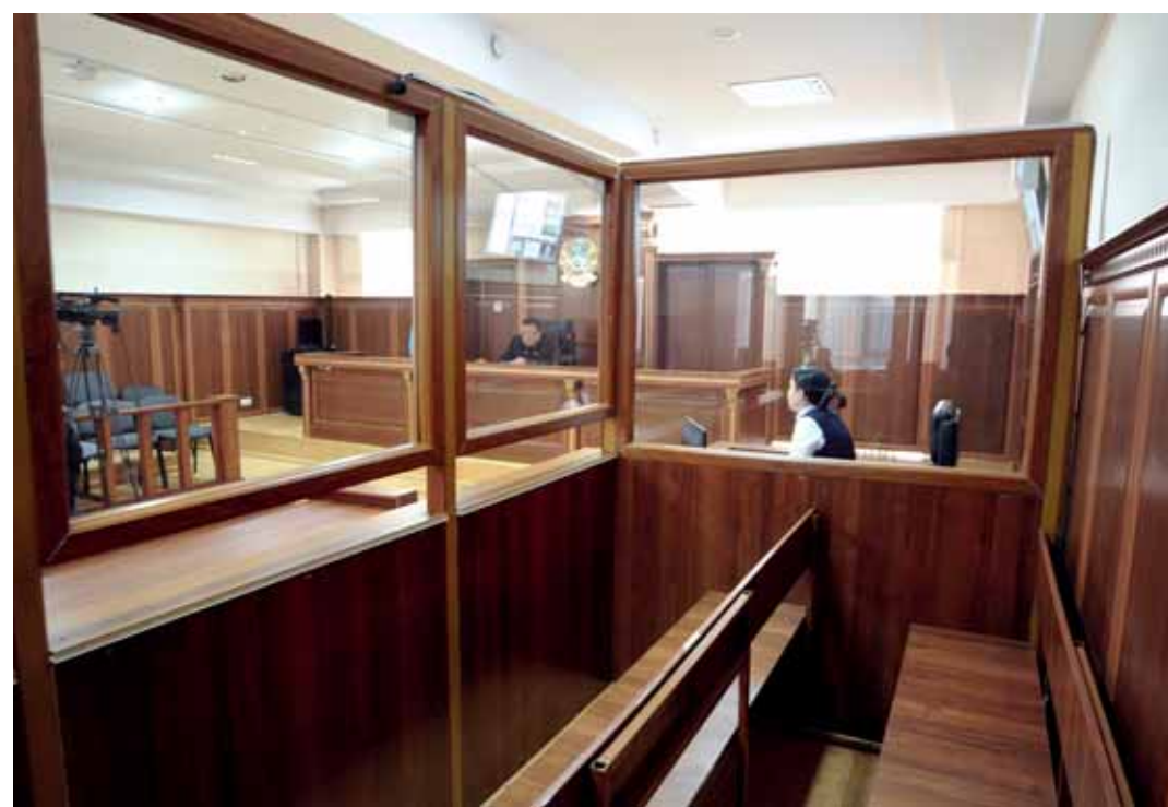
В ходе всего судебного процесса место подсудимого пустовало. Очередной приговор Мухтару Аблязову был вынесен заочно.

Господин Аюпов также вспомнил, что на похоронах Татишева он встретил Аблязова, протянул ему траурную повязку и предложил занять место в почетном карауле. Аблязов тогда отказал